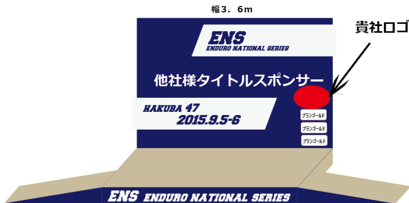
大会バックボード